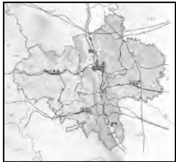
图 2 固原市三类空间划定图

城镇空间要着力提高建设用地集约利用水平，提升单位国土面积的投资强度和产出效率。要控制工矿建设空间和各类开发区用地比例，促进产城融合和低效建设用地再开发。实行农村人口市民化规模与国家财政转移支付力度挂钩、农村人口市民化规模与城镇建设用地新增指标挂钩制度。