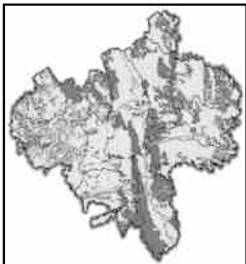
图4 固原市生态保护红线范围图

3. 加强生态保护红线管理。严格遵循《宁夏回族自治区生态保护红线管理条例》，全市生态保护红线勘界定标后，相关规划要符合生态保护红线空间管控要求，不符合的要及时调整，发挥生态保护红线对于全市国土空间开发的底线作用，实现“一条红线”管到底。到2020年，建立生态红线制度，确保生态保护红线面积不减少，性质不改变，主导生态功能不降低。