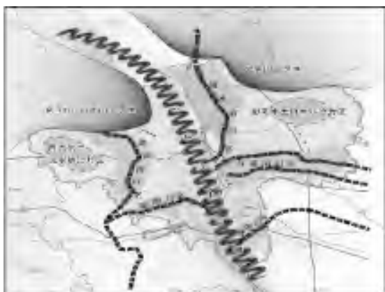
图3 固原市生态安全格局图

资源,营造水源涵养林、水土保持林,实施人工种草,形成稳定的林草生态系统,保护生物多样性,构建大六盘天然绿色生态屏障。两屏:南华山—月亮山和云雾山生态屏障,重点加强山区天然林保育、草原恢复,增强山地涵养水源、保持水土和防风固沙能力,保护生物多样性。五川:原州区清水河、西吉县葫芦河、隆德县渝河、泾源县泾河、彭阳县红河、茹河等河流冲积形成的河谷川道地区,重点加强生态保护。两片:西吉、彭阳两个水土流失片区。在沿线山地、山间平原和黄土丘陵选育耐旱、耐盐碱抗逆植物,重点加强水土流失防治,严禁各类与生态建设无关的开发。