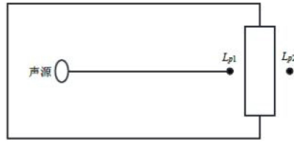
图3 室内声源等效为室外声源图例